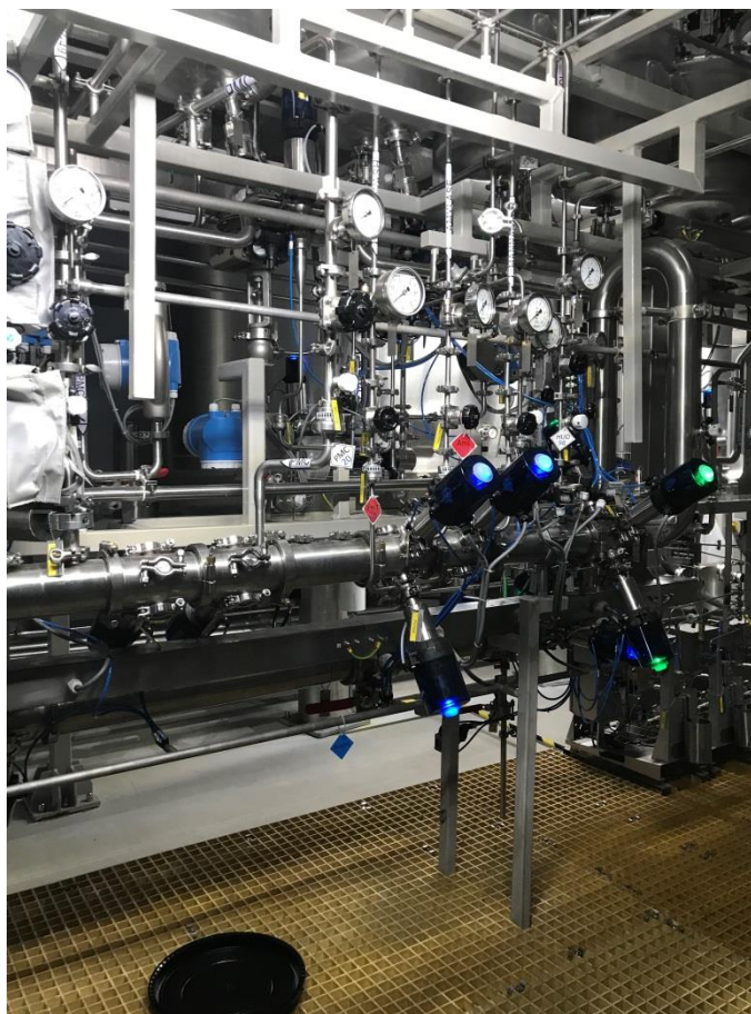
Фото 1. Оборудование ООО «ВеллРус», расположенное в цехе по производству жидких моющих средств