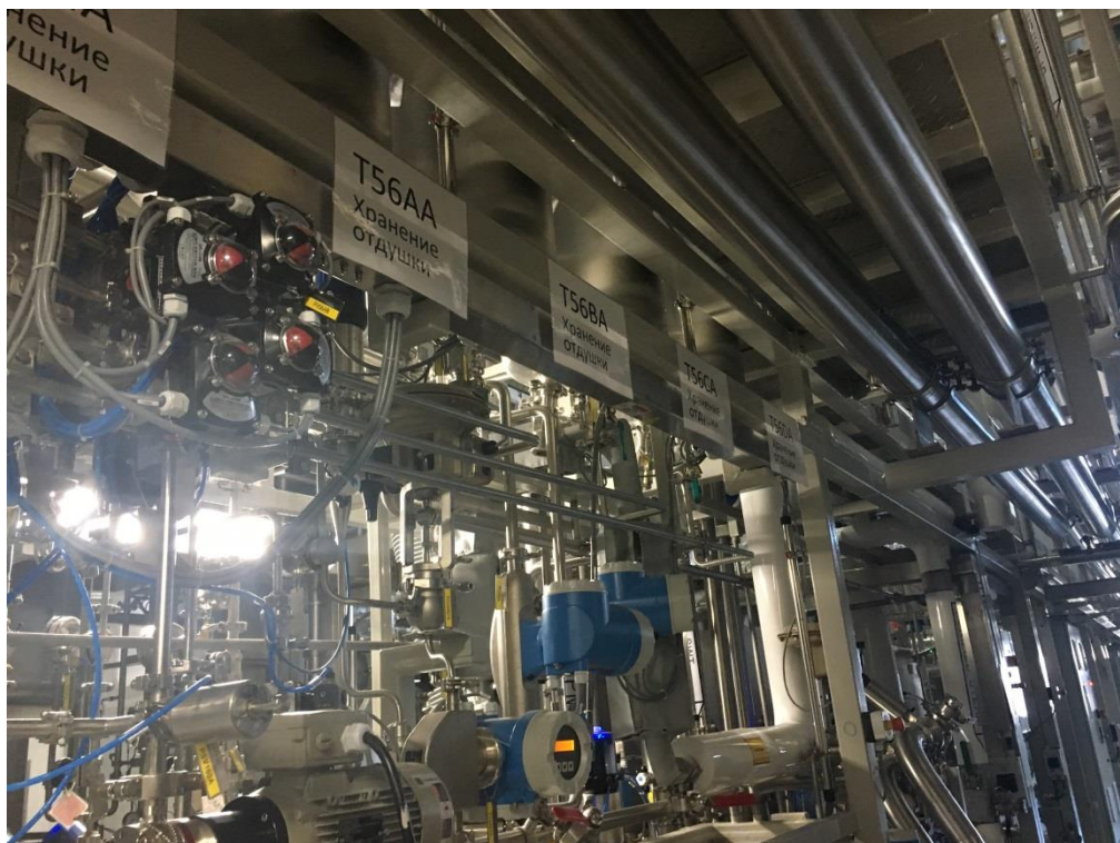
Фото 4. Оборудование ООО «ВеллРус», расположенное в цехе по производству жидких моющих средств