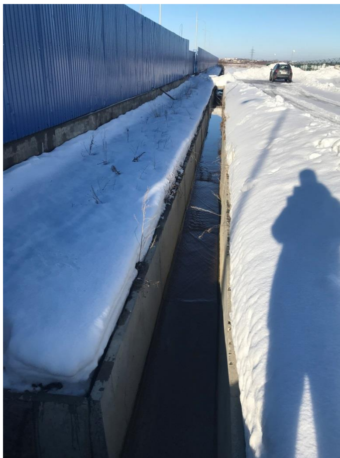
Фото 15. Железобетонный лоток, куда осуществляется выпуск сточных вод после локальных очистных сооружений ООО «ОМХ»