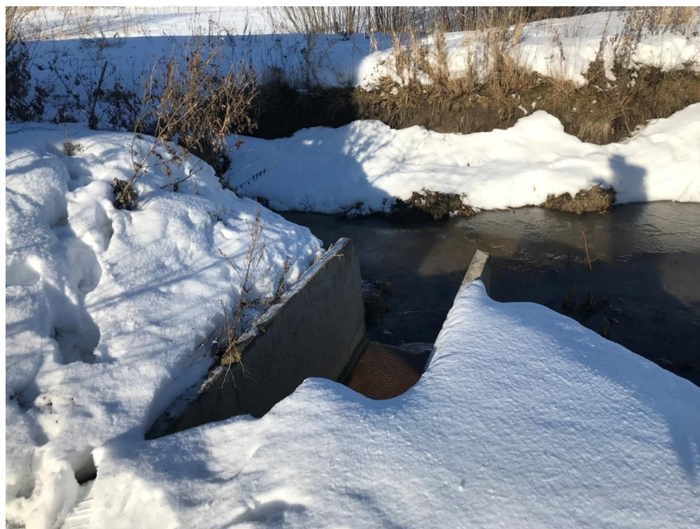
Фото 16. Выпуск сточных вод в канализированный ручей МК-1, приток реки Ижора после очистных сооружений ООО «ОМХ»