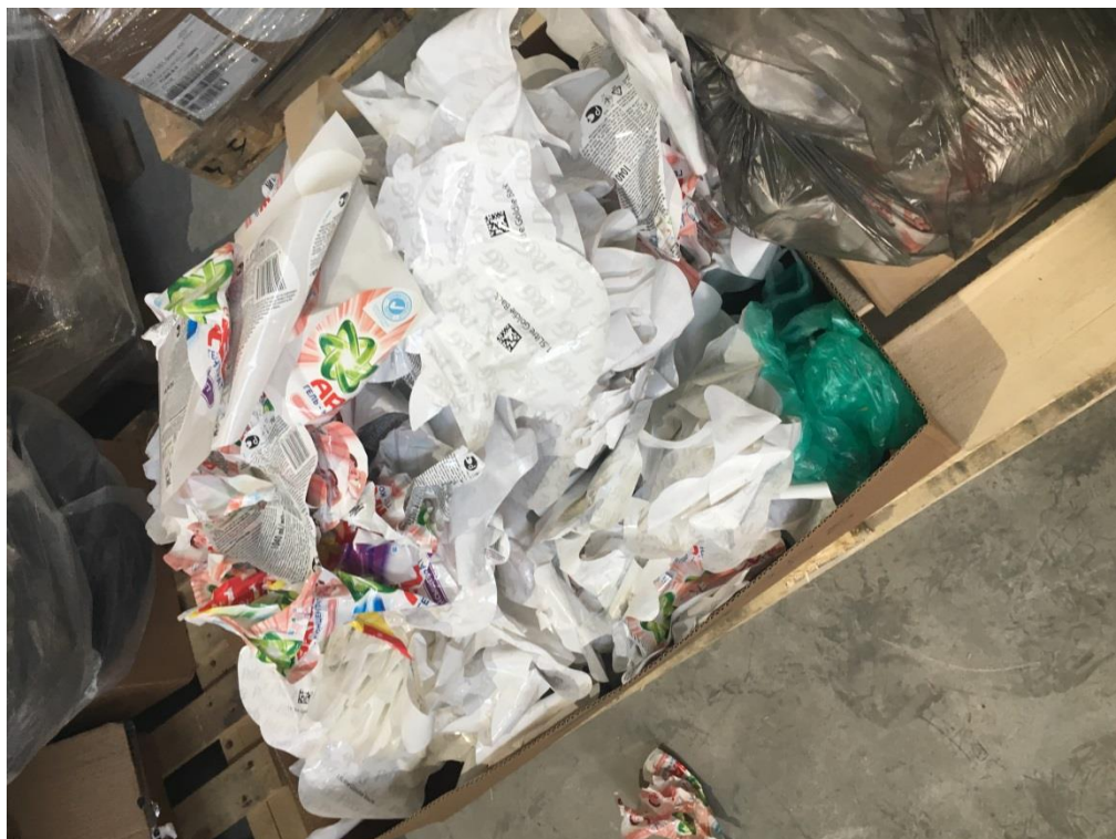
Фото 11. Этикетки, утратившие потребительские свойства

свойства, и тара пластиковая, предположительно используемая для разлива продукции.