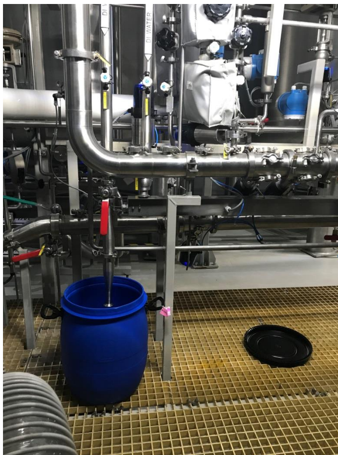
Фото 7. Пластиковая тара, наполненная красителем