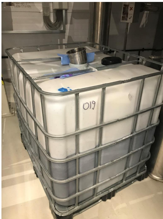
Фото 5. Пластиковый куб, наполненный наполовину синей жидкостью с химическим запахом