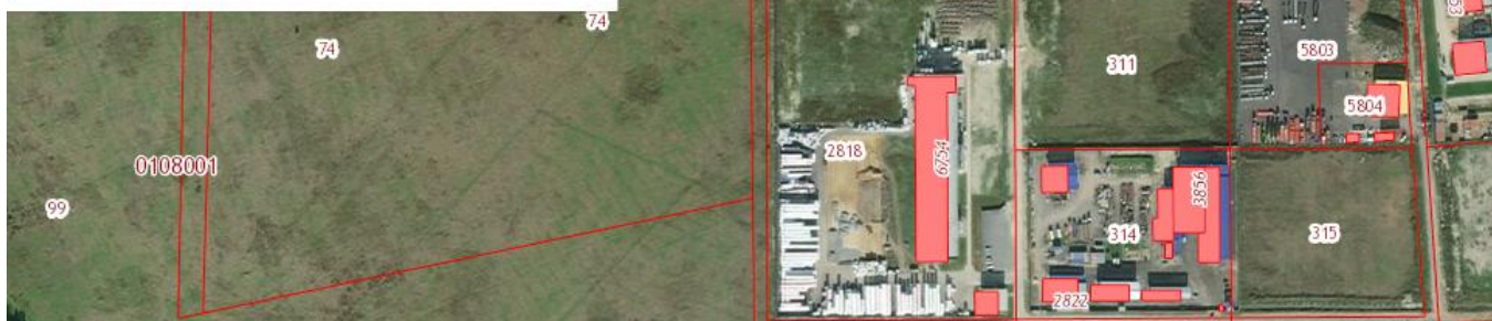
Схема. Расположение земельного участка с кадастровым номером 47:26:0108001:6734