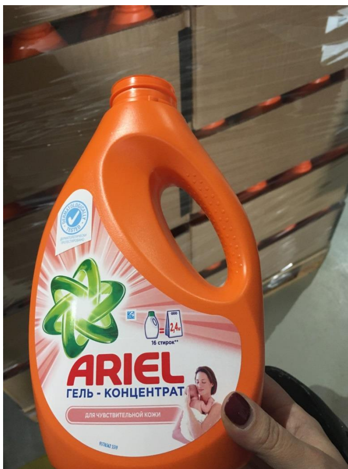
Фото 12. Тара пластиковая предположительно используемая для разлива продукции