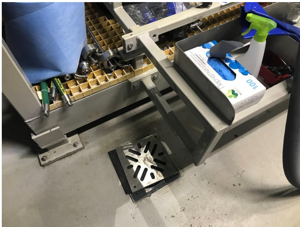
Фото 9. Система сбора сточной воды из производственного цеха

деятельности лица – пол оборудован сливными отверстиями для сбора сточной ВОДЫ.