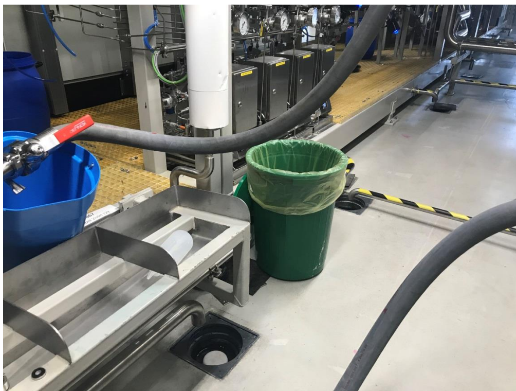
Фото10. Система сбора сточной воды из производственного цеха

Также в ходе проведения осмотра производственной площадки ООО «ВеллРус» обнаружены этикетки известных брендов, утратившие потребительские