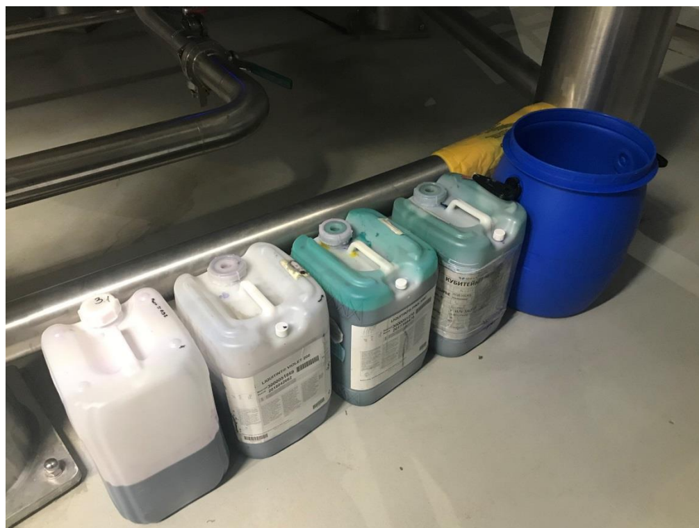
Фото 8. Пластиковая тара, наполненная красителем

Цех по производству жидких моющих средств ООО «ВЕЛЛ РУС» оборудован системой отведения сточных вод, образующихся в результате производственной