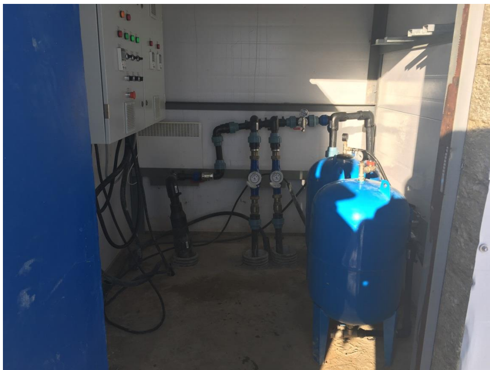
Фото 13. Помещение, в котором находятся скважины ООО «ОМХ».