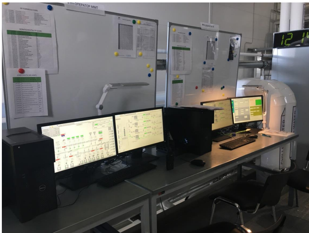
Фото 3. Оборудование ООО «ВеллРус», расположенное в цехе по производству жидких моющих средств