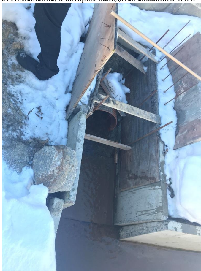
Фото 14. Выпуск сточных вод в железобетонный лоток после локальных очистных сооружений ООО «ОМХ»