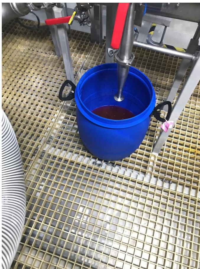
Фото 6. Пластиковая тара, наполненная красителем